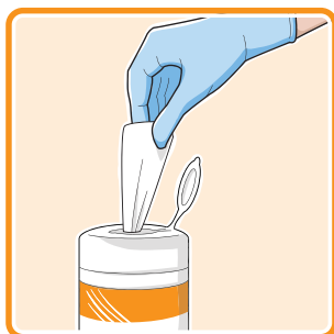
Prendre une lingette